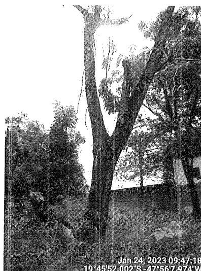
Ipês danificados pela queda da paineira, a serem suprimidos.

Além das situações descritas no quadro acima, foi observado a necessidade de podas de limpeza. Esta Secretaria emitirá a autorização para as supressões e desmontes, considerando que as podas não requerem ato autorizativo.