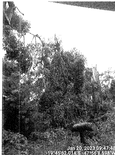
Espécime a ser desmontado.